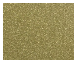
091 Gold Gold Or Золотистый