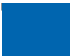
052 ~RAL 5015 Azure blue Azurblau Bleu azur Лазурный