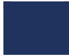
050 ~RAL 5013 Dark blue Dunkelblau Bleu foncé Темно-синий