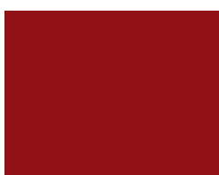
030 Dark red Dunkelrot Rouge foncé Темно-красный