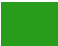
064 ~RAL 6018 ~HKS 65 Yellow green Gelbgrün Vert jaune Желто-зеленый