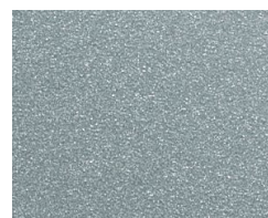
090 ~RAL 9006 Silver grey Silbergrau Gris argent Серебристо-серый