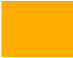
020 ~RAL 1033 ~HKS 5 Golden yellow Goldgelb Jaune or Золотисто-желтый