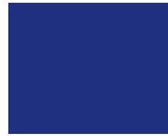
049 King blue Königsblau Bleu royal Королевский синий