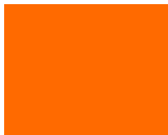
035 ~RAL 2003 ~HKS 7 Pastel orange Pastellorange Orange pastel Пастельно-оранжевый