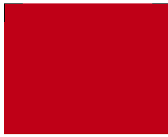
031 Red Rot Rouge Красный