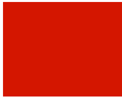
032 Light red Hellrot Rouge clair Светло-красный