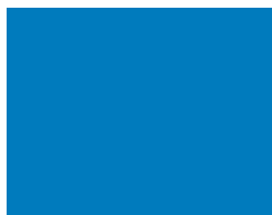
517 Euro blue Euroblau Bleu europe Евро-синий