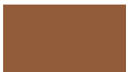
801 Clay brown Lehmbraun Brun glaise