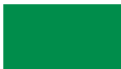
062 Light green Hellgrün Vert clair