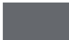
752 Storm grey Betongrau Gris béton