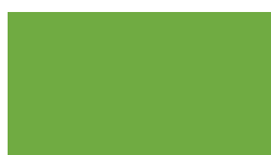
063 ~HKS 66 Lime-tree green Lindgrün Vert tilleul