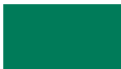
061 Green Grün Vert