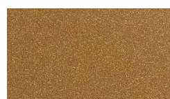
092 Copper Kupfer Cuivré