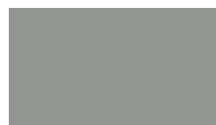
074 ~RAL 7042 Middle grey Mittelgrau Gris moyen