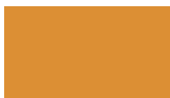
817 Orange brown Orangebraun Brun orange